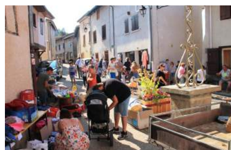
Le vide grenier