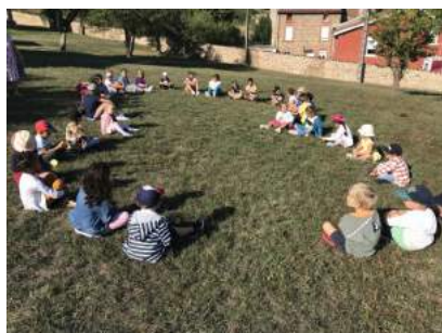
Rentrée des classes