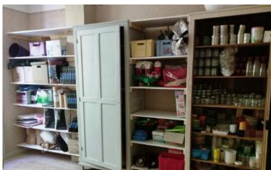
A peine posées, déjà bien investies !!!