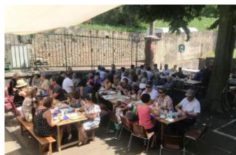
La fête de l'école