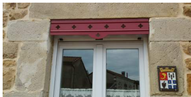
Les lambrequins de la mairie

Ils ont été fabriqués par l'entreprise DELTEC à Saint-Etienne et posés cet été par Pierre Planche. Ils sont du plus bel effet sur une partie de la façade de la mairie, ainsi que sur les fenêtres de l'épicerie « Au Panier de Caty ». La couleur est celle que le conseil municipal utilise pour la plupart des aménagements afin de garder une certaine cohérence (porte vélo, bacs à fleur, grille de puits...).