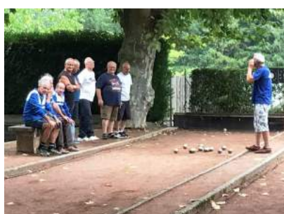
Concours de vacances