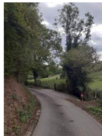
Chemin des creux

Rappelons que la circulation sur cette route est réduite à 40 km/h.