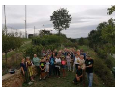
Vendanges à la butte