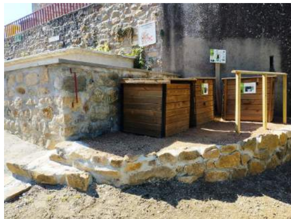
Le compost réaménagé !!!

Vous pouvez consulter le catalogue des jeux de la Ludothèque et réserver vos jeux en ligne... Renseignez-vous ! Pour ce trimestre, elle passera les 05/09, 03/10 et 05/12