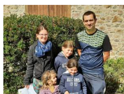
Chasse aux trésors